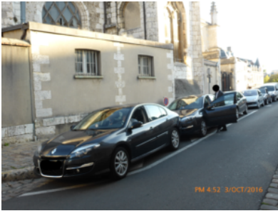
La Préfecture et son parking privé