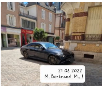
L'Avocat du Diable