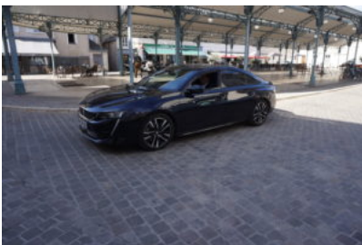
Préfecture en Ville