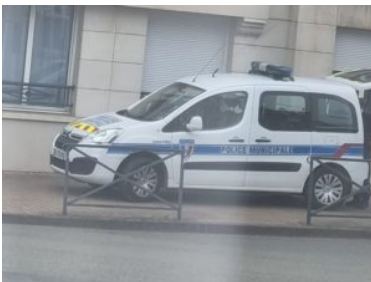
Police Municipale sur le trottoir