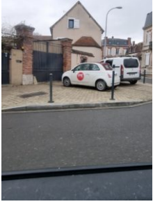
La fille du Maire sur le trottoir