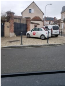
La fille du Maire sur le trottoir