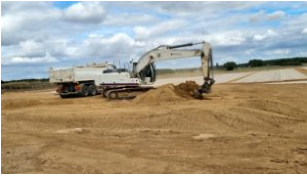
*Chantier entrée Nord Chartres, sur 120 514 M2