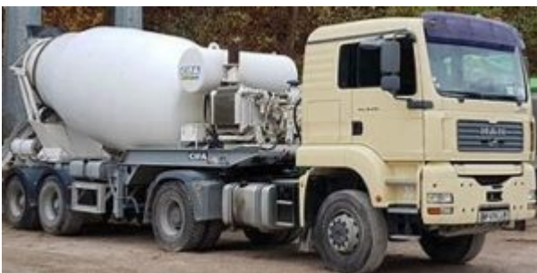
(toupie de béton)

Le doute n'est plus possible, les projets de bétonisation , vont bien connaître une accentuation dans Chartres et les alentours.