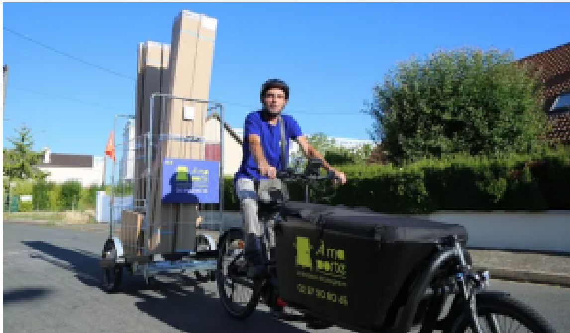
Après neuf ans de procédures, Chartres Métropole et la région Centre-Val de Loire subventionnent le projet artisanal eurélien à hauteur de 500.000 €.